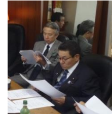
笠浩史 衆議院議員 盛山正仁 衆議院議員