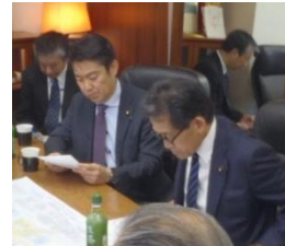
逢沢一郎 衆議院議員 山下貴司 衆議院議員